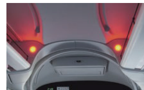
赤色フラッシャー・・・EDSSの作動を乗客に伝達