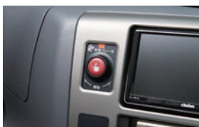
非常ブレーキスイッチ・・・運転席、客席(左右の最前列上部に設置)