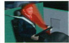
モニターカメラがドライバーの運転状態を録画