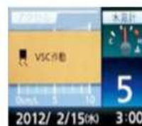
(VSC装着車と非装着車の比較)

横転や雪道などの滑りやすい路面における危険を抑止します。カーブでの車線のはみ出しや横転などを抑止するため、警報音やエンジンの出力制限、ブレーキ作動で、運転士の回避操作を的確にサポートします。