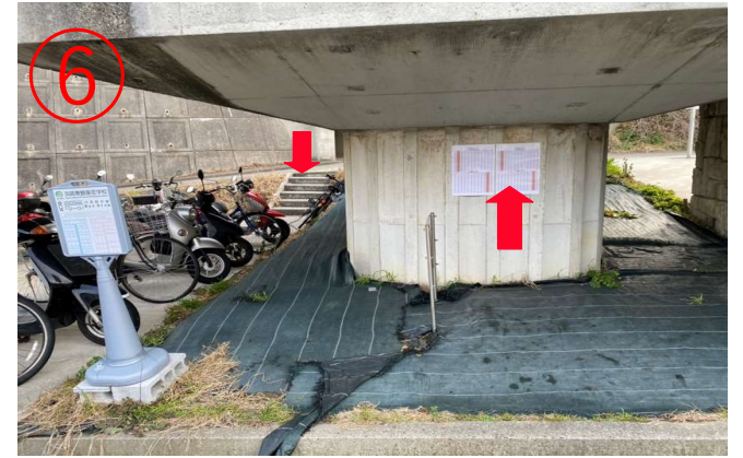
6, 桥墩上面贴有免费接驳车的发车时间表。