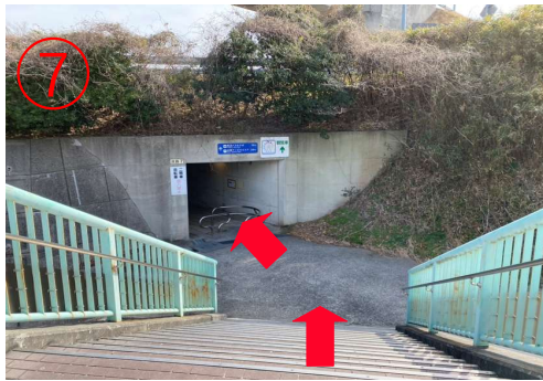
7. 下桥后，对面是隧道入口。