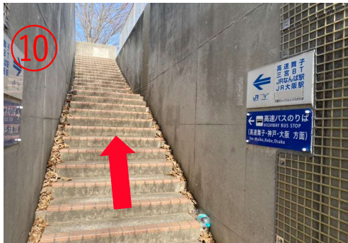
10. 从左手边的楼梯上去。