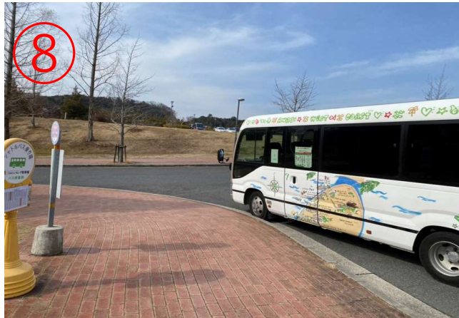
8, 到达二次元之森F停车场。 ※回程也在此处上车。