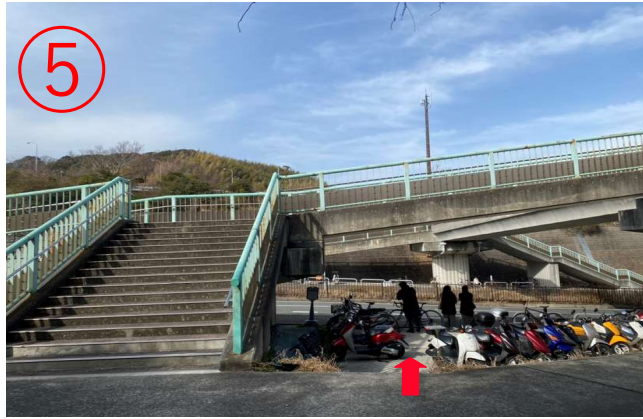
5, 在隧道口附近有个小楼梯，下楼梯后在左侧桥墩附近候车。