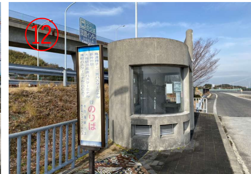
12. 到达「淡路IC」巴士站。( 回程高速巴士的乘车处。 )