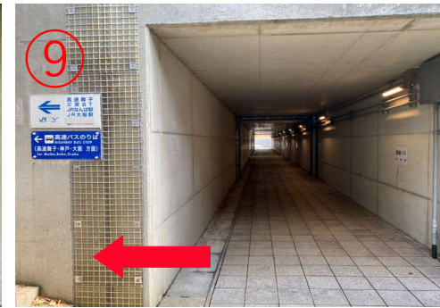
9. 步行约50m，左右两侧是通往高速巴士乘车处的楼梯。