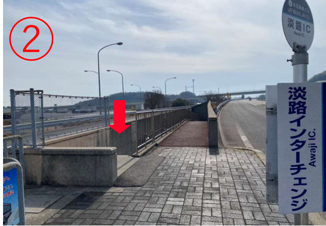
2, 车站附近有通往地下通道的楼梯。