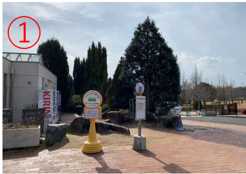
1. 二次元之森 F 停车场的免费接驳车站。