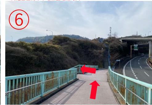
6. 从左侧的楼梯下桥。