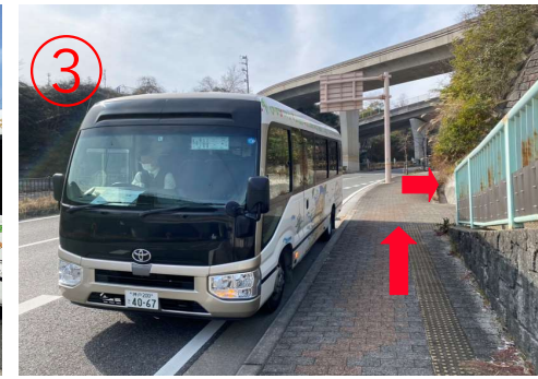
3. 到达淡路IC。 ※高速巴士的乘车地点在道路对面。