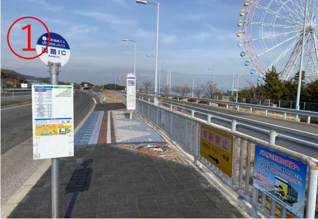
1, 从大阪/神戸方面驶来的高速巴士到达「淡路IC」站。