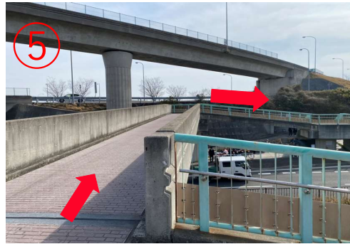
5. 沿着桥上的道路过桥。