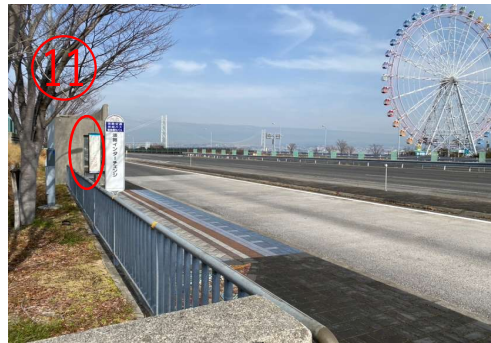
11. 楼梯上去后，就可以看见「淡路IC」巴士站。