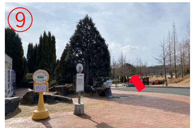
9, ニジゲンノモリの入口。 「ゴジラ迎撃作戦」最寄り