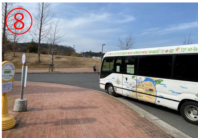
8, ニジゲンノモリF駐車場に到着。 ※帰りも同じバス停