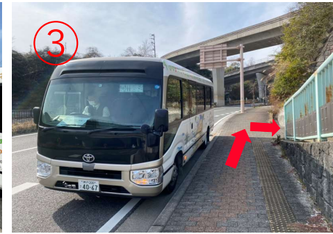
3, 淡路ICに到着。 ※高速バス乗り場は道路の反対側にある。