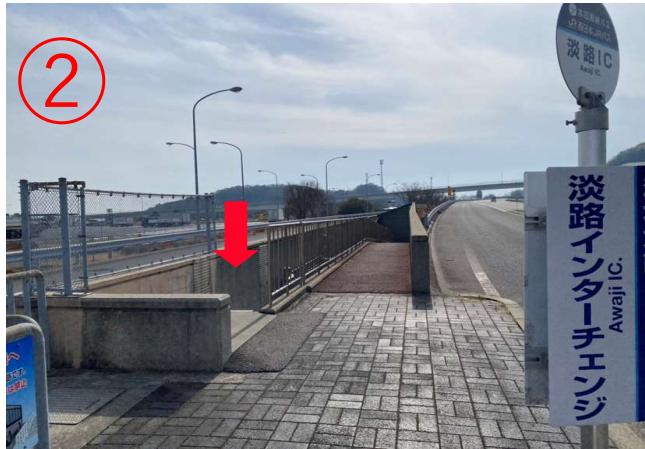
2, 後ろに階段が見える。