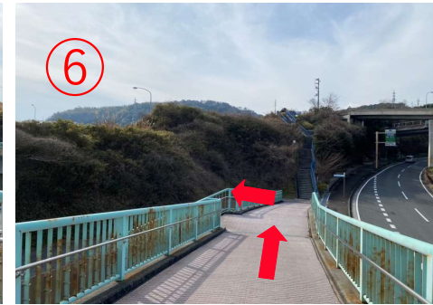
6, 左手の階段から橋を降りる。