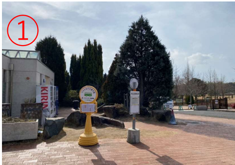
1, ニジゲンモリ駐車場の無料シャトルバス乗り場。