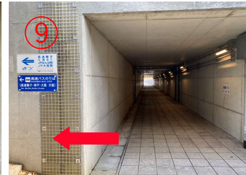
9, 少し進むと、左右両側に階段が見える