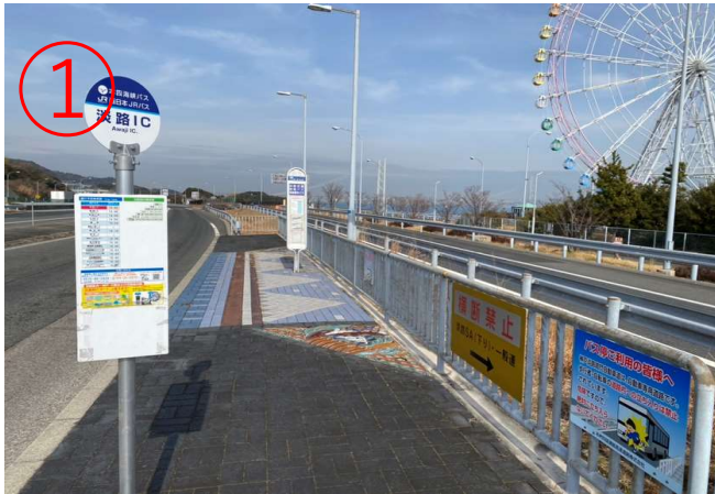
1, 大阪/神戸方面からの高速バスは「淡路IC」に到着。