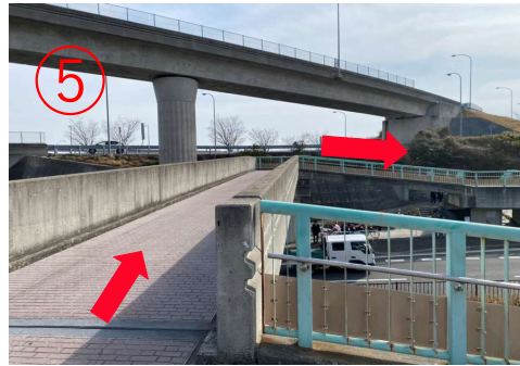
5, 橋を渡り、道に沿って進む。