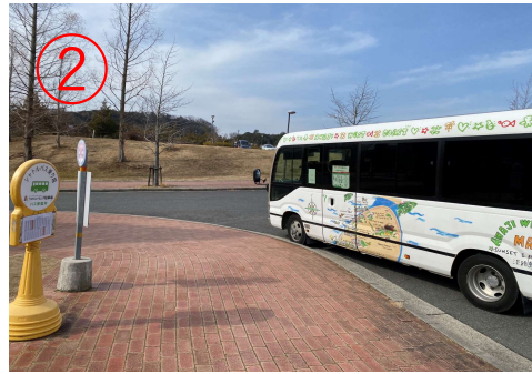
2, 無料シャトルバスに乗車。