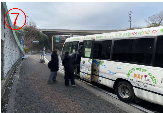
7, 無料シャトルバスに乗車。