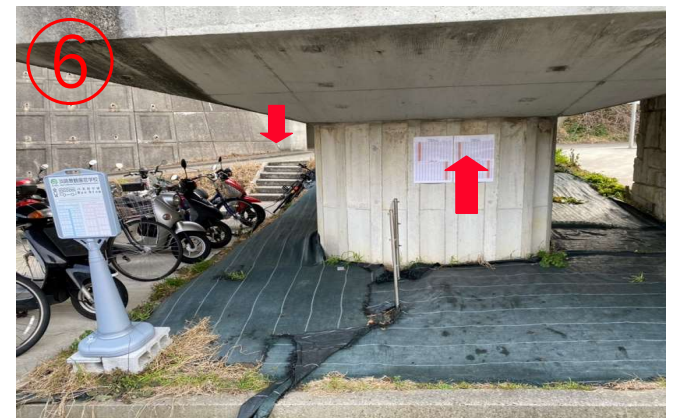
6, 橋の壁に無料シャトルバスの時刻表がある。