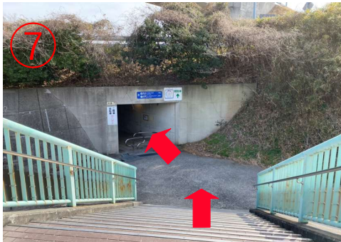
7, 橋を降りると、トンネルが見える。