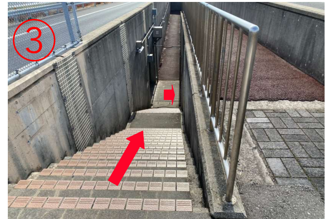
3, 階段を降りて右手に曲がる。