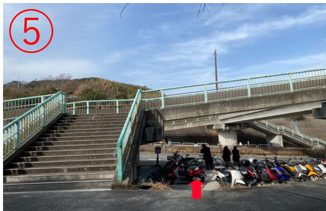
5, トンネル出口付近の階段を下ると無料シャトルバスの乗車場所。