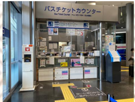
JR 버스 티켓 카운터