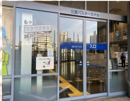
산노미야 버스터미널 입구