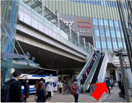
산노미야 버스터미널 (민트고베 1층)

※버스는 전석 지정제입니다. QR 코드 제시는 버스에 승차할 수 없으므로 주의하시기 바랍니다.