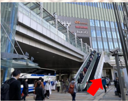
三宫巴士总站 (MINT神戸1楼)

●换票方法： 请至三宫巴士总站 (MINT神戸) 内JR巴士售票柜台，出示您的电子票二维码。预约去程 (三宫→有马温泉) 和回程 (有马温泉→三宫) 的班次及座位，兑换往返乘车券。 (往返乘车券的有效期间为3天。无论是当天往返或者是在温泉旅馆住宿时使用都很方便。) ·自乘车日的1个月1天前的上午十点开始受理换票。 例) 【预计搭乘日：05月01日】→1天前：04月30日→1个月前→【03月30日 AM10:00开始可以换票】 ●使用方法： 兑换的纸质乘车券，请在搭乘巴士时向司机出示。 ※巴士全车指定座席。仅出示电子票的二维码，将无法搭乘，请务必提前至换票窗口换票。