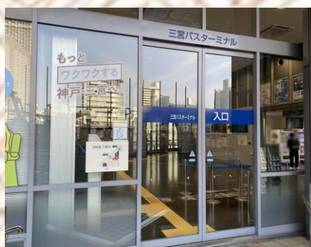
三宫巴士总站入口