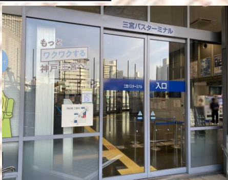
三宮巴士總站入口