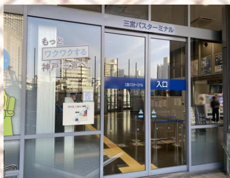
三宮バスターミナル入口