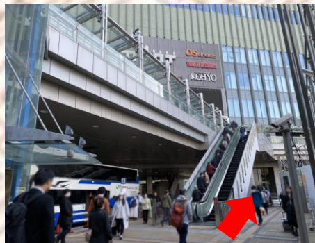
三宮バスターミナル(ミント神戸1階)

※バスは全席指定制です。QRコードの提示では、バスに乗車できませんので、ご注意ください。