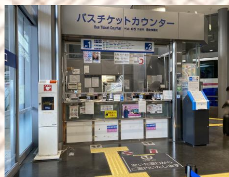
JRバスチケットカウンター