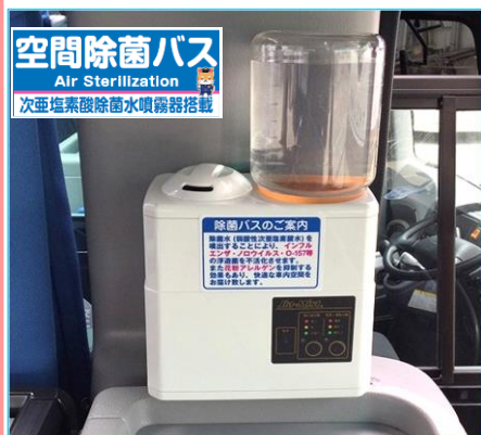
■次亜塩素酸除菌水噴霧器