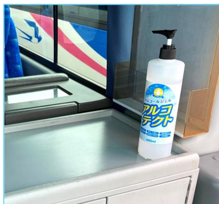
■手指用アルコール消毒液設置