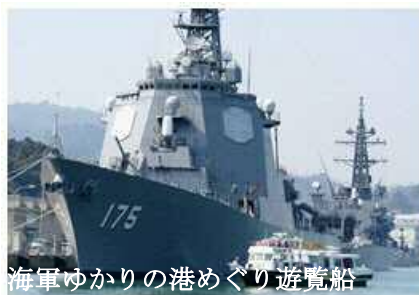
海軍ゆかりの港めぐり遊覧船