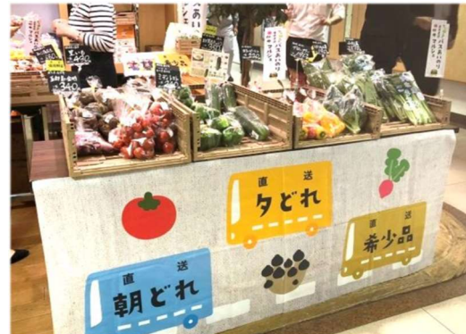
【2018年10月実施時の一例】

今後は、イベント開催に加えて都内の飲食店やオフィス等への定期的な配送など「産地直送あいのり便」の規模拡大に努めてまいります。